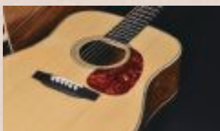
▲希少性が極めて高い北米産アディロンダックスプルース

さらにヘッドウェイの豊富な木材ストックの中でも特に希少なアディロンダックスプルースをボディトップだけでなくブレイシングにまで使用し、加えてボディのサイド・バックにはホンジュラスローズウッドを使用しました。ローズウッドの中でも低音域、高音域ともに豊かに響くホンジュラスローズと、アディロンダックスプルースの組み合わせにより、倍音成分がしっかりと出るリッチで豪華なサウンドが実現しました。