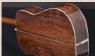
▲ニューハカラダとも呼ばれる「ホンジュラスローズウッド」