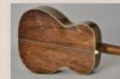
▲楕目で木取ることで—際力ある外観に。