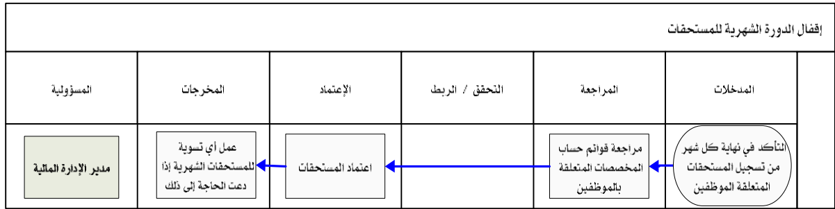
شكل رقم / ٥

يوضح المخطط البياني التالي ( شكل رقم/٥) طريقة تسلسل العمل لإقفال الدورة الشهرية للمستحقات: