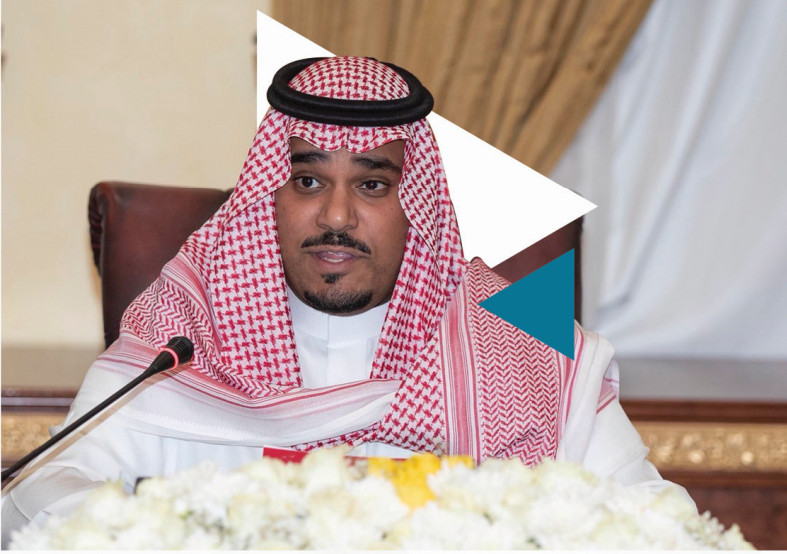
الأمير تركي بن هذلول آل سعود

حافظت المملكة بقيادته على ثوابتها فاستمرت على نهج الملك المؤسس عبدالعزیز بن عبدالرحمن آل سعود - رحمه الله فشكلت نهضتها التنموية والحضارية الاتزان بين تطورها والتمسك بقيمها الدينية والإنسانية .