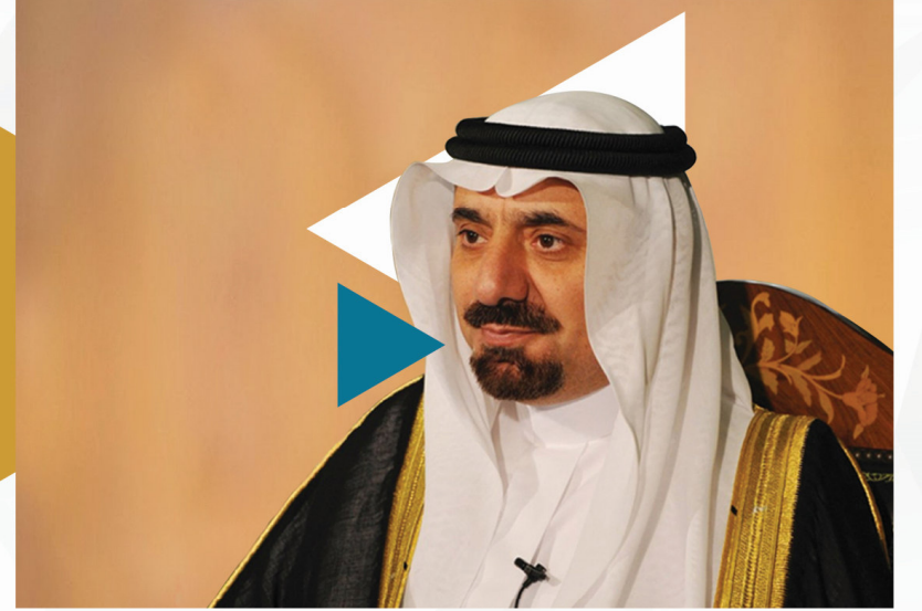
الأمير جلوي بن مساعد آل سعود

منهج المملكة، قيادة وشعباً بين كلمة التوحيد وتوحيد الكلمة وهذا ما يكمن في تمسكهم بالشرعية السمحة ويبرز في وحدة كلمتهم ببيعة ولي الأمر والالتفاف حوله، والسمع والطاعة له .