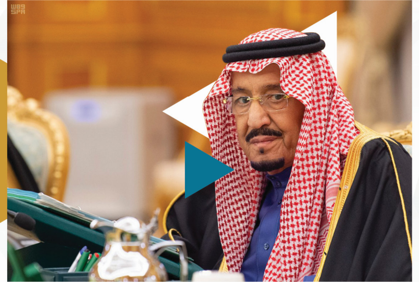
الملك سلمان بن عبدالعزيز آل سعود

سنظل بحول الله وقوته متمسكين بالنهج القويم الذي سارت عليه هذه الدولة منذ تأسيسها على يد الملك عبدالعزيز - رحمه الله - وأبناءؤه من بعده رحمهم الله - ولن نحيد عنه أبداً ودستورنا هو كتاب الله وسنة نبيه .