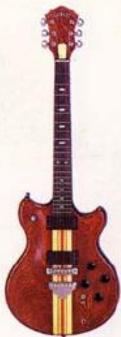
GO900 ¥90,000 セン+セン+センボディ 削り出しアーナドトップ メイプル+ウォルナット 7P スピードウェイネック PU-3DSピックアップ×2 シングルサウンド・スイッチ×2 GO900N、GO900DS GO900V