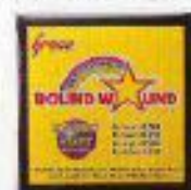
PR-2095S (ショートスケール) 050-070-020-110

R-500 / Y-500 / G-500 ¥ 2,000 ショート、ミディアム、ロングスケールの3種類をラインアップした、ステンレス・ ワウンドのベース弦。