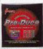
PD-3000L (ロングスケール) 045-065-085-105

BN-6000 ¥ 6,000 独特のチタンとクワンが人気のブucker・ナイロン仕様のベース弦。