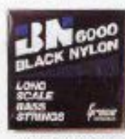
BN-6000 (ロングスケール) 070-085-007-117

BN-6000 ¥ 6,000 独特のチタンとクワンが人気のブucker・ナイロン仕様のベース弦。