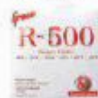
R-500 (スーパー・ワイルド) 065-011-019 024-032-042

R-500 / Y-500 / G-500 ¥ オープンブライス ボンダライト処理を施したストレート巻のコアを 採用した、ステンレス・ワウンドのギター弦。