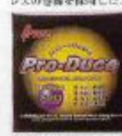
PD-3000S (ショートスケール) 045-065-085-105

PD-3000S / PD-3000M / PD-3000L ¥ 3,000 鍛造されたクワットマンシェイプする美しい正六角形のコアに、鍛造されたステン レスの巻線を採用したステンレス・ワウンドのベース弦。