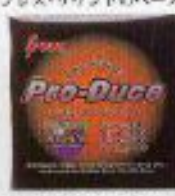
PD-3000M (ミディアムスケール) 045-065-085-105