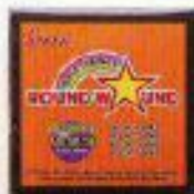
RW-2000M (ミディアムスケール) 045-065-085-105