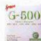
G-500 (ハイ・グランド) 029-011-010 026-039-046