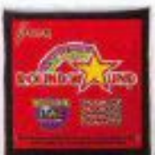
RW-2000L (ロングスケール) 045-065-085-105

RW-2800 ¥ 2,800 ポールセレン層に従来の2倍の太玉ポールエンドを採用することで、低音 音の増幅とサステインの向上が図られた、ニッケル・ワウンドのベース弦。