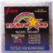
RW-2800 (ロングスケール) 045-065-085-105

RW-2800 ¥ 2,800 ポールセレン層に従来の2倍の太玉ポールエンドを採用することで、低音 音の増幅とサステインの向上が図られた、ニッケル・ワウンドのベース弦。