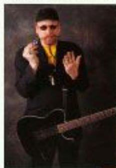
Rick Nielsen CHEAP TRICK

リア・ピックアップの力を借りて、フロントに取り付けられたドライバーの周辺に強力な磁界を作り、弦を強制振動させるこのシステムは、スケール、フレット数、リア・ピックアップの種類によって、作られる磁界に差異が生じるため、自分のギターに最適なキット内容をチョイスすることが重要です。