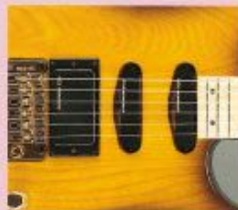
F.G.I.-SH ¥30,000 F.G.I.-S x 2, F.G.I.-H x 1, 1V・2Tアッセンブリー

F.G.I.ピックアップシリーズは、ワイドレンジ、ローノイズ、ハイパワーが特徴のアクティブ・ピックアップ(ローインピーダンス・ピックアップ)。専用設計の各種部材を使用し、巻き線の素材には無酸素鋼を採用。また新設計のプリアンプを通して出力することにより、完成度がさらに高まっている。クリアでブライトな高音域とタイトな低音域をもつサウンドキャラクターは、発売以来10年以上の間に各種改良を重ね、さらに洗練されたといえるだろう。ギター用シングルコイル(S)、ハムバッカー(H)、ベース用Pタイプ(P)、Jタイプ(J)をそろえ、各組み合わせにより7種類のセットが用意されている。