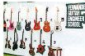
楽器フェア出展作品