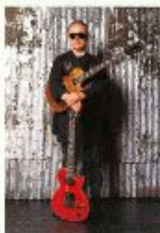
Robert Fripp KING CRIMSON