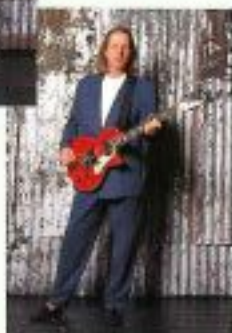
Adrian Belew KING CRIMSON