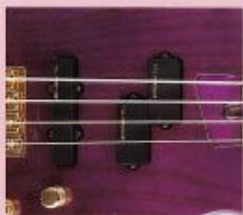
F.G.I.-PJ ¥22,000 F.G.I.-J x 1, F.G.I.-P x 1, 2V・1Tアッセンブリー