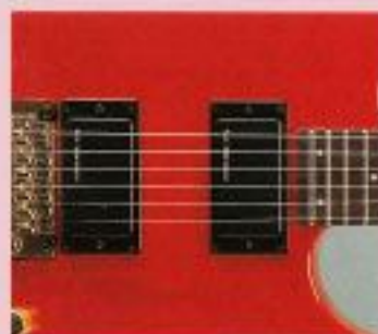
F.G.I.-H ¥12,000 F.G.I.-H x 1, 1V・1Tアッセンブリー