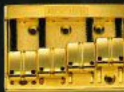
BB-8 ¥7,500(CR) ¥8,000(GL, BL)