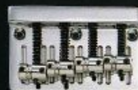
BB-4 ¥5,500(CR) ¥6,500(GL, BL)