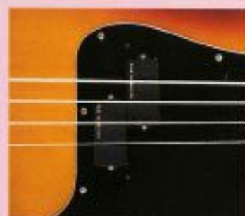
F.G.I.-P ¥13,000 F.G.I.-P x 1, 1Vアッセンブリー