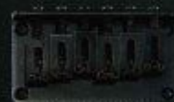
GB-1 ¥5,000(CR) ¥6,000(GL, BL)