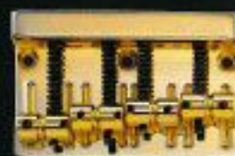
BB-5 ¥5,500(CR) ¥6,500(GL, BL)