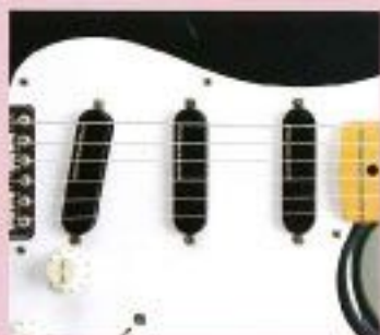
F.G.I.-3S ¥28,000 F.G.I.-S x 3, 1V・2Tアッセンブリー F.G.I.-2S ¥20,000 F.G.I.-S x 2, 1V・1Tアッセンブリー