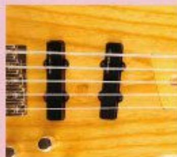
F.G.I.-J ¥22,000 F.G.I.-J x 2, 2V・1Tアッセンブリー