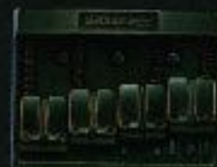
BB-7 ¥7,500(CR) ¥8,000(GL, BL)