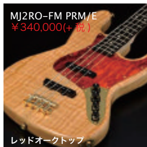
MJ2RO-FM PRM/E ¥340,000(+税)