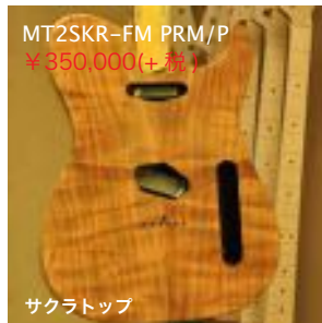
MT2SKR-FM PRM/P ¥350,000(+税)