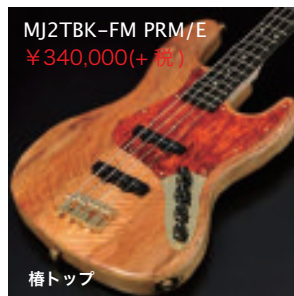
MJ2TBK-FM PRM/E ¥340,000(+税)