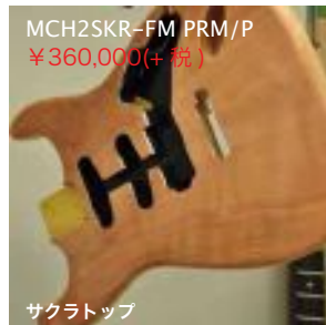
MCH2SKR-FM PRM/P ¥360,000(+税)