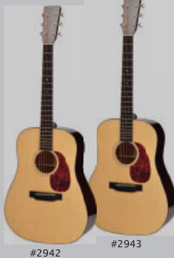
#2942 #2943 HD-180CM 各¥600,000(+税)

超希少なキューバンマホガニーをサイド・バックに使用した特別モデル。Xプレイングの位置に違いを持たせた2本を制作