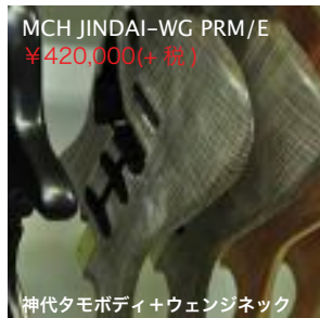
MCH JINDAI-WG PRM/E ¥420,000(+税)