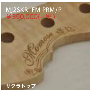
MJ2SKR-FM PRM/P ¥350,000(+税)