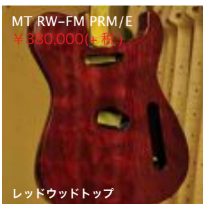
MT RW-FM PRM/E ¥380,000(+税)