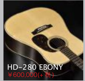
HD-280 EBONY ¥600,000(+税)