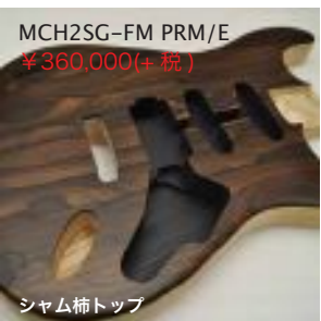
MCH2SG-FM PRM/E ¥360,000(+税)