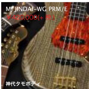
MJ JINDAI-WG PRM/E ¥420,000(+税)