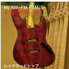
MJ RW-FM PRM/E ¥380,000(+税)