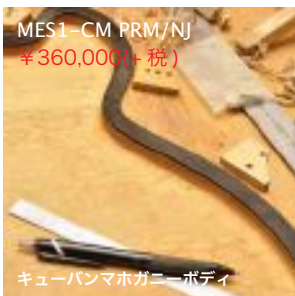
MES1-CM PRM/NJ ¥360,000(+税)