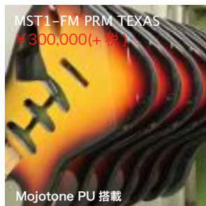
MST1-FM PRM TEXAS ¥300,000(+税)