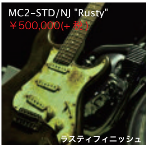
MC2-STD/NJ "Rusty" ¥500,000(+税)

パンフレット発行時点で制作中のものでございます。最新情報は特設ウェブページをご確認ください。