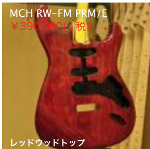
MCH RW-FM PRM/E ¥390,000(+税)