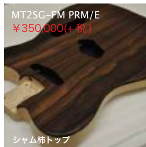
MT2SG-FM PRM/E ¥350,000(+税)