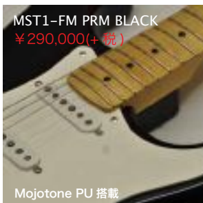
MST1-FM PRM BLACK ¥290,000(+税)