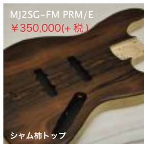
MJ2SG-FM PRM/E ¥350,000(+税)