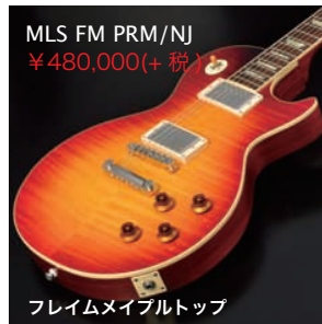
MLS FM PRM/NJ ¥480,000(+税)