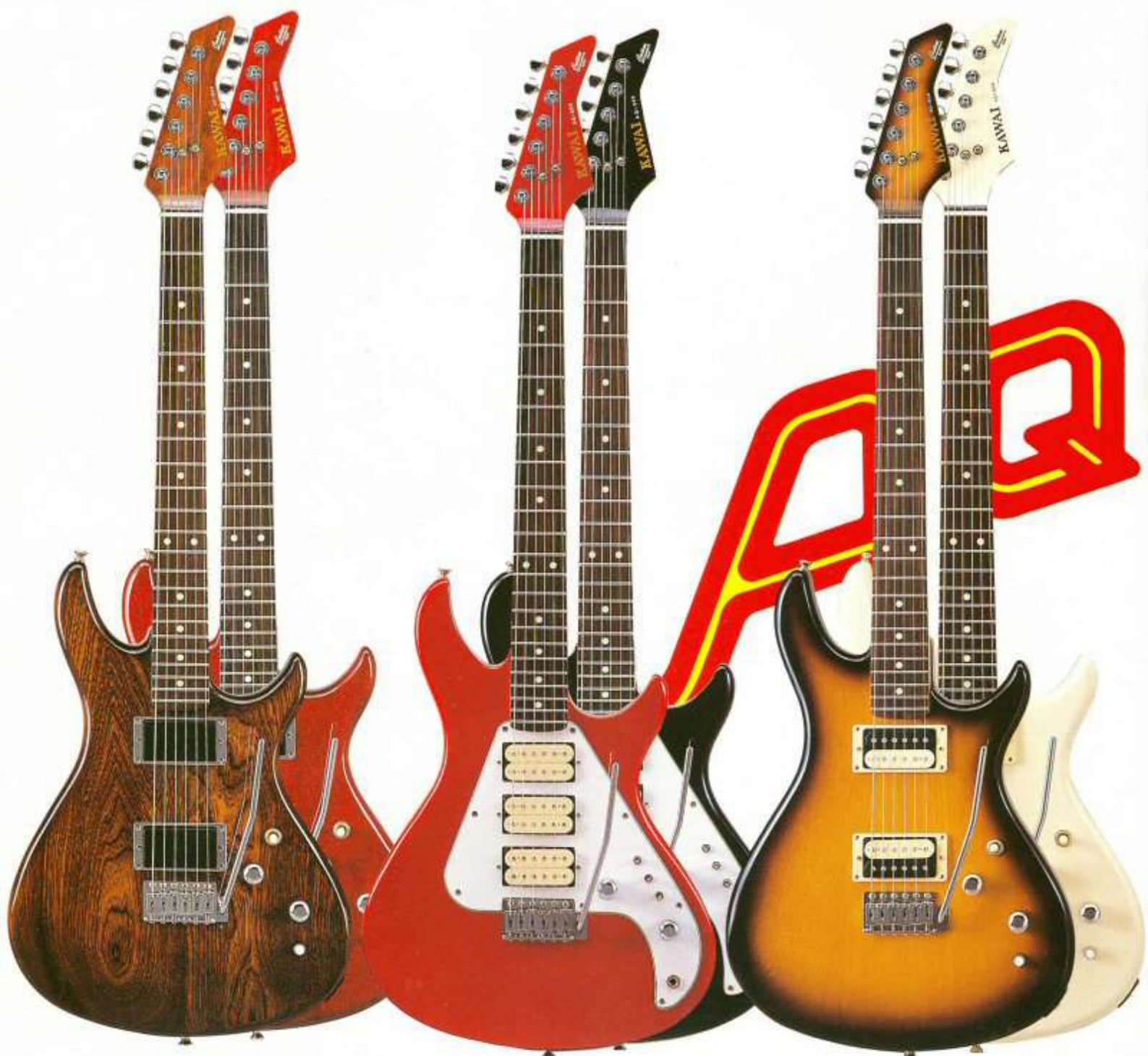
AQ-605 [ UK · UP ]