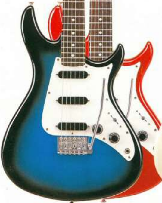
AS-405 [ BBS · CAR ]