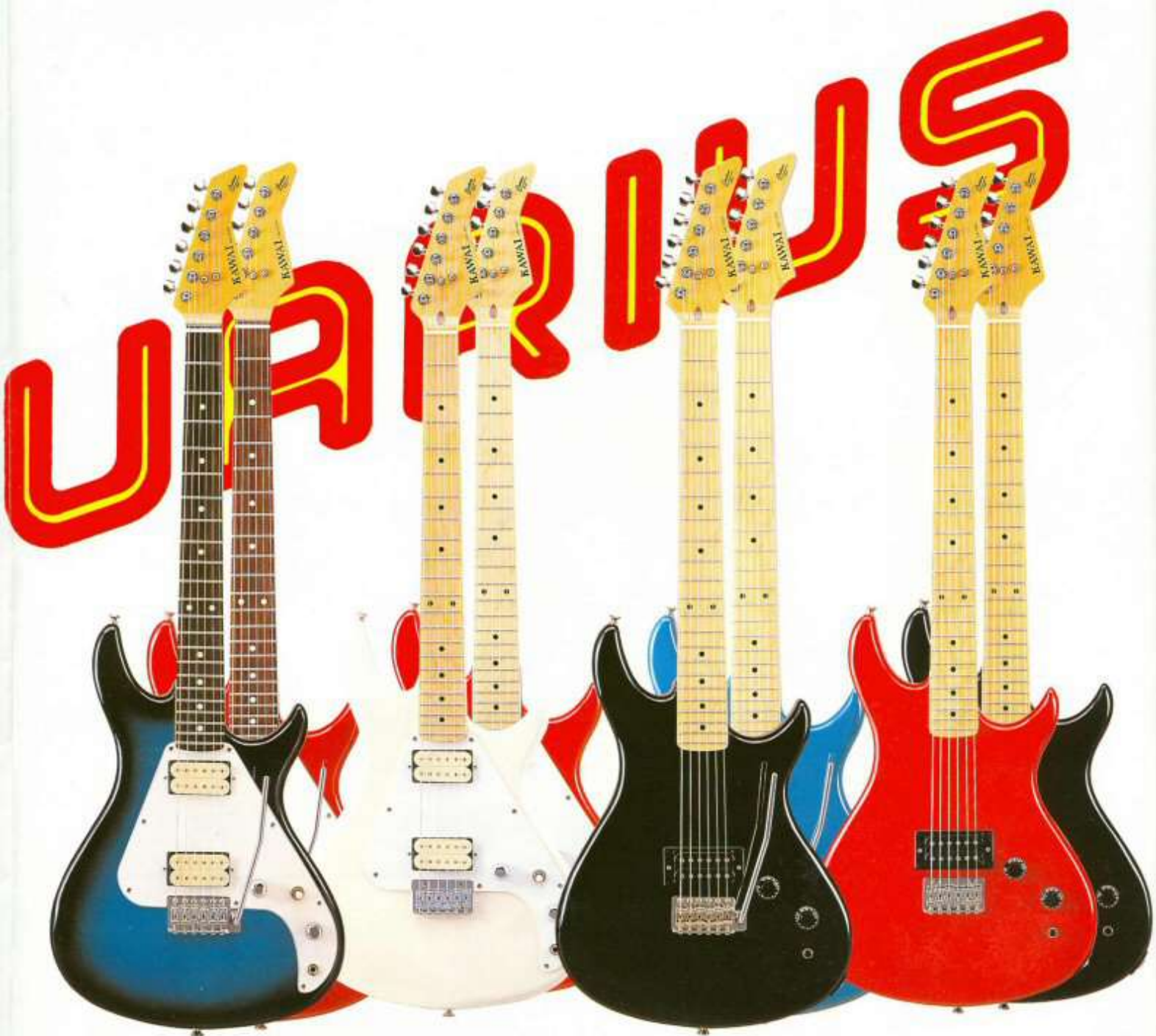
AQ-405 [ BBS · CAR ]