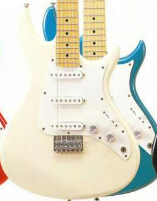
AS-401 [ CW · BLUE ]