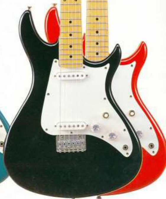
AS-301 [ BL · RED ]