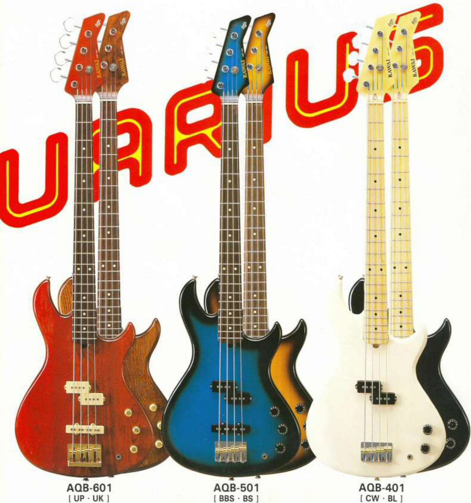
AQB-601 [ UP · UK ]