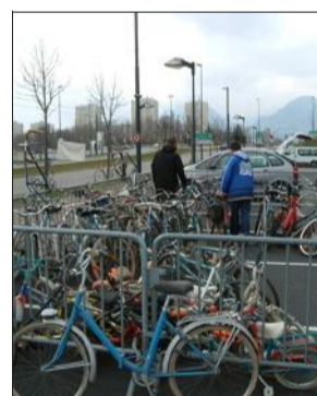
Les vieux vélos seront collectés au pôle technique à partir de lundi 21 novembre.

Une visite du centre de tri d'Athanor est prévue mardi 22 novembre à 18 heures, mercredi 23 à 13 h 30 et jeudi 24 à 18 heures (gratuit, sur inscription au 04 38 24 11 00). Un atelier couches lavables est proposé mardi 22 novembre de 19 h à 20 h 30 dans l'es-