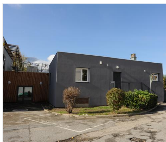
Le local "la Passerelle", situé rue du Petit-Lac, entre le collège Chartreuse et la station de tramway Néron, vient d'être rénové. C'est là que le CCAS organise une aide aux devoirs.