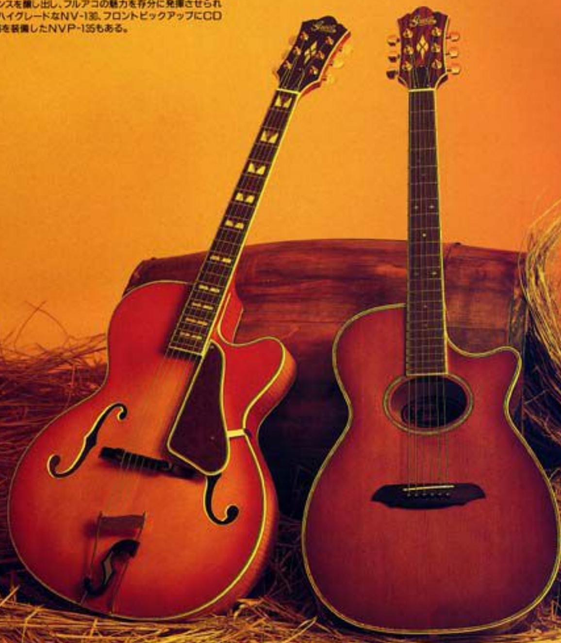
Photo: on the left, NV-130, on the right, MFK-90S

入念なハンドクラフト作業により味わい深いトーンニュアンスを醸し出し、フルアコの魅力を存分に発揮させられるハイクレードなNV-130、フロントピックアップにCD-58を装備したNVP-135もある。