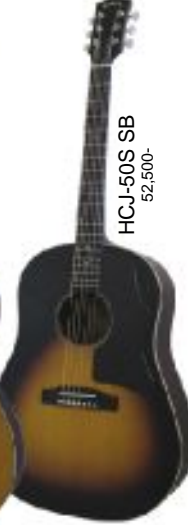
HCJ-50S SB 52,500-