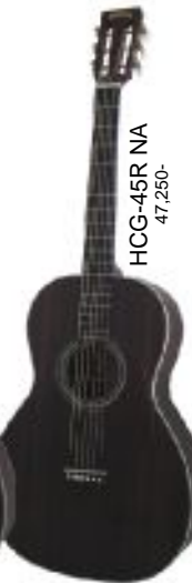
HCG-45R NA 47,250-