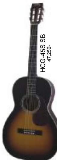
HCG-45S SB 47,250-