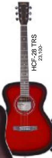
HCF-28 TRS 23,100-