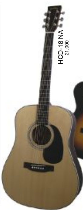
HCD-18 NA 21,000-

ヘッドウェイ・ユニバースシリーズはビギナーの方へコストパフォーマンスの優れた、高品質のギターを提案する為にスタートしました。ユニバースシリーズのスタートにあたり、中国の提携工場へ国内の職人を派遣、以後品質管理は徹底しています。そして今や多くのプレイヤーにご満足を頂いております。これからも、ビギナーの方にとって手に取りやすく、なお且つ上達に繋がる安定した品質を追求し、提案してまいります。