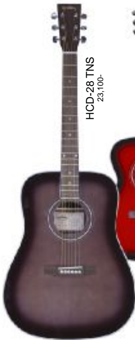
HCD-28 TNS 23,100-

Top:Solid Sitka Spruce Side,Back:Laminated Rosewood Neck:Mahogany Finger Board:Rosewood Scale:650mm Width at Knut:43mm color:AN,SB with Soft Case