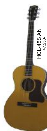
HCL-45S AN 47,250-