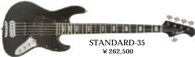
STANDARD-35 ¥ 262,500