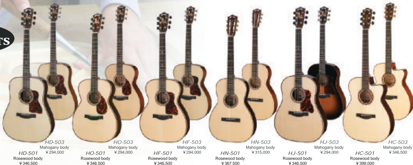
HD-501 Rosewood body ¥ 346,500 HD-503 Mahogany body ¥ 294,000 HO-501 Rosewood body ¥ 346,500 HO-503 Mahogany body ¥ 294,000 HF-501 Rosewood body ¥ 346,500 HF-503 Mahogany body ¥ 294,000 HN-501 Rosewood body ¥ 367,500 HN-503 Mahogany body ¥ 315,000 HJ-501 Rosewood body ¥ 346,500 HJ-503 Mahogany body ¥ 294,000 HC-501 Rosewood body ¥ 399,000 HC-503 Mahogany body ¥ 346,500

ヘッドウェイを特徴付ける細部に及ぶ巧みなクラフトワークによる優れたバランスの美しい響きに、現代的なフィンガースタイルに対応するソフトな音色を加味した、ヘッドウェイ・ニュースタンダード。