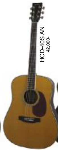
HCD-40S AN 42,000-