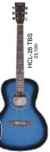
HCL-28 TBS 23,100-