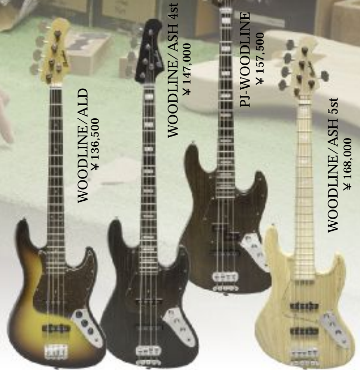
WOODLINE/ALD ¥ 136,500

BODY: LIGHT ASH / NECK: MAPLE / FINGERBOARD: EBONY or MAPLE / SCALE (FLET) :34inch (21F) / PICKUP: WOODLINE/ASH4&WOODLINE/ASH5=Bacchus JB-ALV SET, PJ-WOODLINE=Bacchus PJ-ALNICO, JB-ALV / WIDTH at KNUT:4ST=38mm, 5ST=46mm / TUNER: GOTOH GB11W / BRIDGE: BACCHUS DB / STRINGS:4ST=045-105, 5ST=045-130 / FINISH: LACQUER SATIN (NECK) LACQUAR GLOSS or OIL FINISH (BODY) / with ORIGINAL GIG BAG