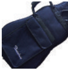
オリジナルギグケース付属 (別売定価¥13,125(ベース用の場合))

楽器用の素材として十分な品質を持つ、アメリカンハードメイプル、カナディアンアルダー/アッシュ等、物作りの基本となる素材から見直し、品質を追求しました。低価格の楽器にありがちな外観だけのものではなく、あくまでも音質の良さを最大のアピールポイントにしたい。BACCHUS GLOBAL SERIESは本物志向のユーザーを品質でサポートします。