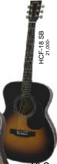
HCF-18 SB 21,000-