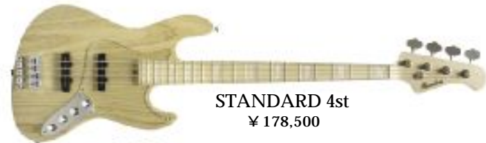
STANDARD 4st ¥ 178,500