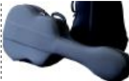
Light hard case付属

カスタムシリーズ、スタンダードシリーズでは、指板にウッドバインディングを施しています。一見解かり難い部分ではありますが、乾燥などの影響により木材が収縮する事でフレットの縁が飛び出す「バリ」のトラブルを未然に防ぐ事が出来ます。未永い愛用、そして演奏性への配慮です。