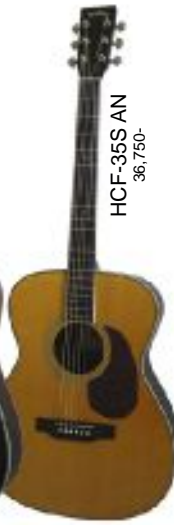
HCF-35S AN 36,750-