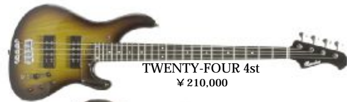
TWENTY-FOUR 4st ¥ 210,000

BODY: LIGHT ASH / NECK: MAPLE3P / FINGERBOARD: EBONY or MAPLE / SCALE (FLET) : 34inch (24F) / PICKUP: Bacchus BHB-ALV SET / PREAMP: bartolini XTCT + MC500 / WIDTH at KNUT: 4ST=38mm, 5ST=46mm / TUNER: GOTOH GB707 / BRIDGE: BACCHUS DB / STRINGS: 4ST=045-105, 5ST=045-130 / FINISH: LACQUER SATIN (NECK) LACQUAR GLOSS (BODY) or OIL FINISH (BODY) / with ORIGINAL GIG BAG