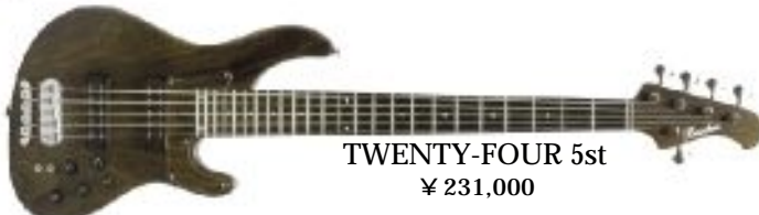
TWENTY-FOUR 5st ¥ 231,000