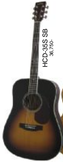
HCD-35S SB 36,750-