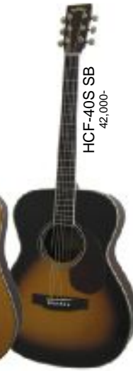
HCF-40S SB 42,000-