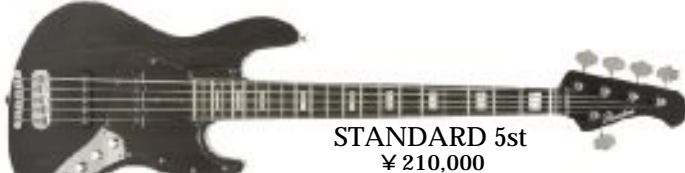
STANDARD 5st ¥ 210,000