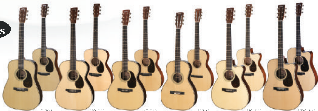
HD-701 Rosewood body ¥ 346,500 HD-703 Mahogany body ¥ 294,000 HO-701 Rosewood body ¥ 346,500 HO-703 Mahogany body ¥ 294,000 HF-701 Rosewood body ¥ 346,500 HF-703 Mahogany body ¥ 294,000 HN-701 Rosewood body ¥ 367,500 HN-703 Mahogany body ¥ 315,000 HC-701 Rosewood body ¥ 399,000 HC-703 Mahogany body ¥ 346,500 HDC-701 Rosewood body ¥ 399,000 HDC-703 Mahogany body ¥ 346,500

昭和のヘッドウェイサウンドを今に蘇らせた音色。伝説を作り上げた、剛性感のある煌びやかで粒立ちの良い極上のアコースティックサウンドを奏でます。