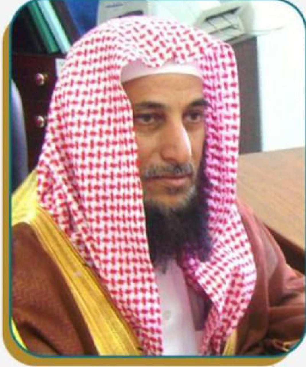
فضيلة الشيخ عمرو السلمي