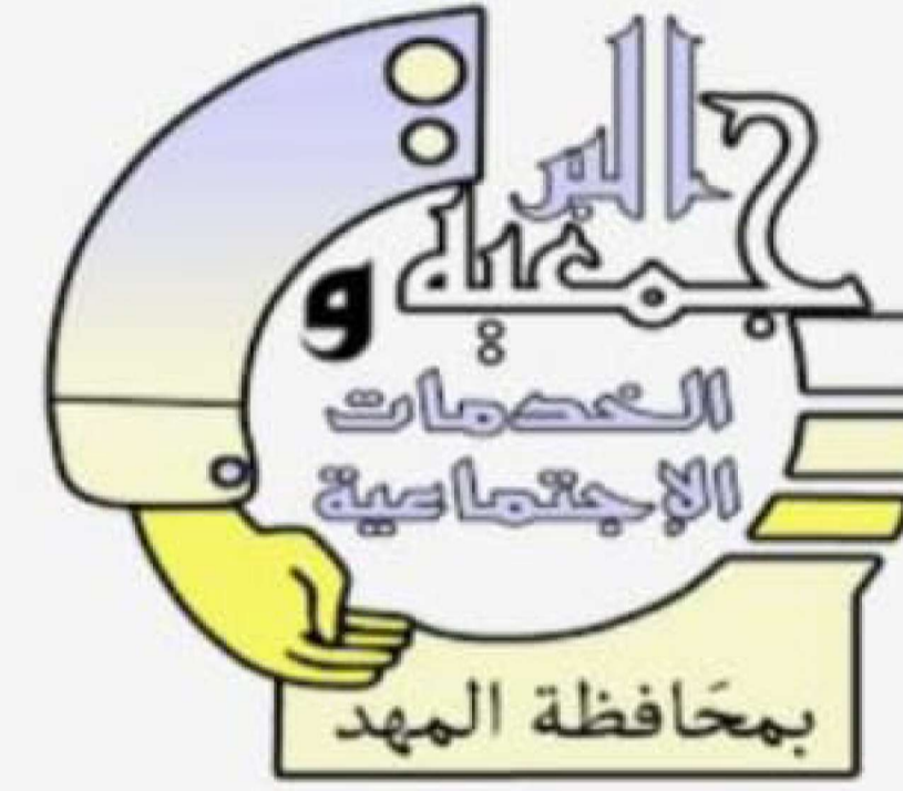
جمعية البر والخدمات الاجتماعية بالمهد