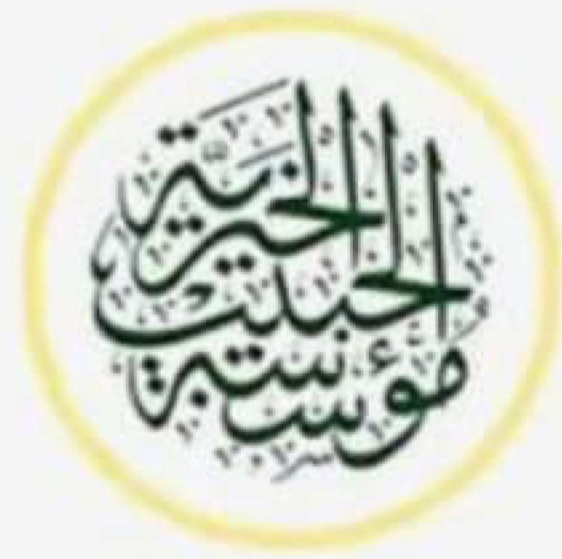
مؤسسة محمد بن عبدالعزيز الحبيب وأولاده الخيرية