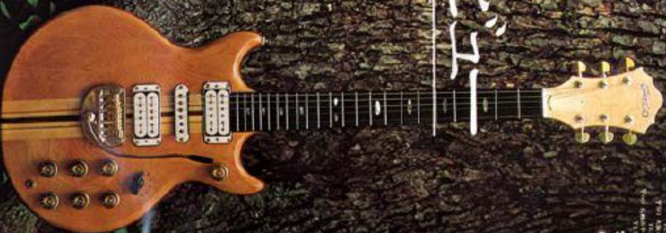
GO III (Electric) Price: ¥150,000

GRECO GUITARS THE BEST GUITARS IN THE WORLD FOR MUSICIANS AND MUSIC LOVERS ESTABLISHED 1962 JAPAN