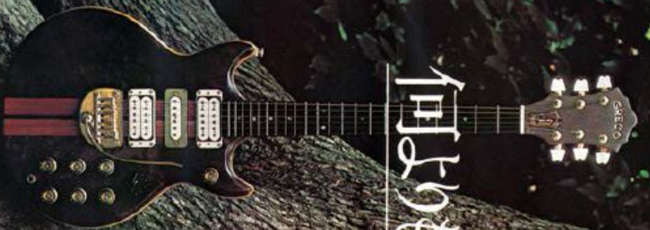
GO III (Electric) Price: ¥150,000