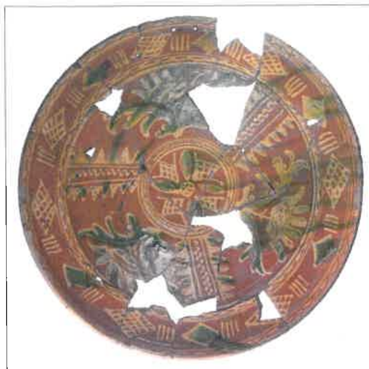
Deens slibversierd aardewerk uit Husum (2).

Witte, F., 2014. (in druk) Bemalte Teller im Garten. Eine Töpferei der Renaissance in Husum. Husum (D)