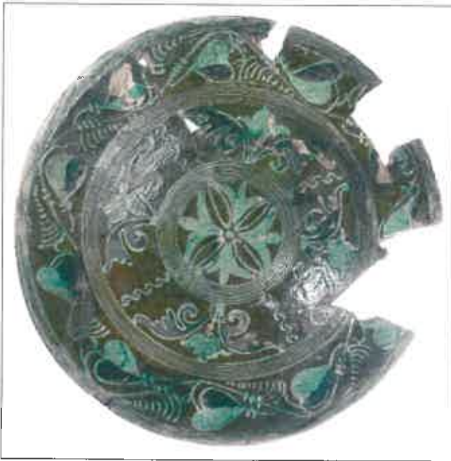
Deens slibversierd aardewerk uit Husum (1).

Meestal komen in West-Friesland met slib gedecoreerd roodbakkerende borden van zogenaamd 'North Holland Slipware' voor. Dit is herkenbaar aan een baksteenrode scherf, de plumpe uitvoering, aan de bovenzijde helder loodglazuur met tinten groen en vooral aan de opvallende witte slibdecor. Deze zijn als het ware met de slagroomsput 'de ringeloor' dik op het leerharde ongebakken bord aangebracht. Dit is opmerkelijker was de vondst van deze drie borden, verzameld in een kuil. Deze vorm en decoratiewijze was nog niet eerder waargenomen in dit gebied. Betekende dit een nieuw soort importmateriaal?