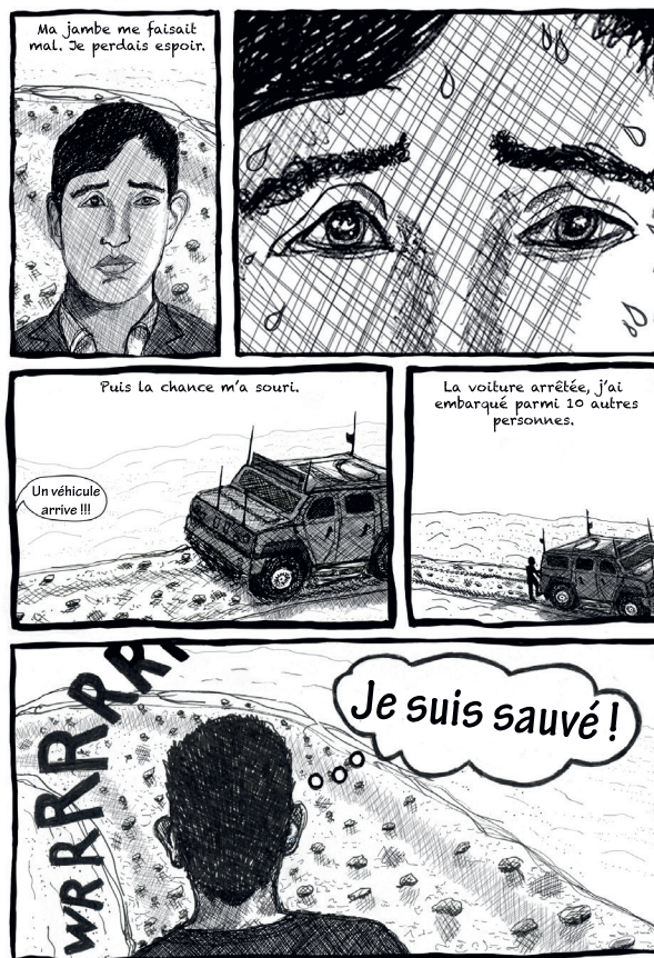
L'ATTENTE Terrés 26 heures dans une cave