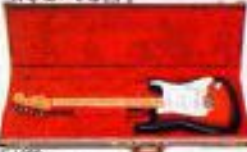
SE1200 本体 ¥120,000 ケース ¥32,000

スーパーリアリズムのニューフェイス、SE1200は78年モデル、あのハニー・クワン・サンバーストを鑑み、オブリジナルでもまれにしか見ることのないフロント・インメイブルネックを贅沢にもセットしてある。ピックアップはシングルコイルの"DRY"ともいえる別冊誌のSQLRにEGFは、じっくり音を聴いてほしい。