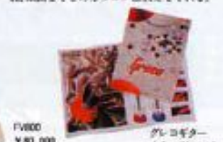
PV800 ¥80,000 グレコギター カラロVid.13

ギターについてより多くの事を知願とするのならやはりカタログを拝見するのが一番だ。1本のギターに費やされる多くの工程、期間までこのカタログは教えてくれる。