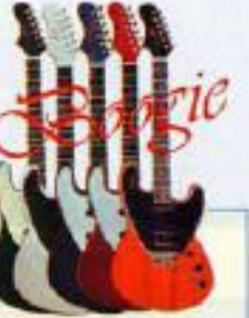
BE2800 本体 ¥70,000 ケース ¥10,000