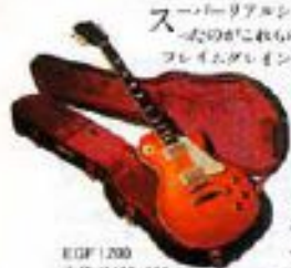
EGF1200 本体 ¥105,000 ケース ¥15,000

スーパーリアリズムの口火を切ったのがこれらEGFシリーズだ。フレームレイアウトが美しく引き出ているギブソン・トップは色に深みと落ちつきを醸し出してくれる。もちろんサウンドもグレイト。オンパーストレンジのニックネームを刻んでいるEGF1200はコレクターアイテムのオールドカウセザ料現し、オリジナルP・A・Dと同性能の"DRY"ピッチアップをマウントした強力な78年モデル、スタジオモニターから飛び出て来るEGF1200の"DRY"のサウンドプロの時でも上とした評判となってい