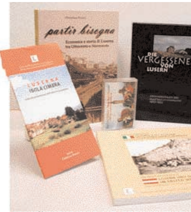
Alcune delle pubblicazioni del Centro Documentazione Luserna

Accanto a queste attività, il Centro Documentazione Luserna, quale luogo di produzione di ricerca storica e conservazione della sua memoria, ha dedicato molte delle proprie risorse all'editoria. Un libro può attraversare il tempo e i suoi contenuti, le sue riflessioni e la ricostruzione del passato in esso racchiuse sono un simbolo della volontà di sfidare il tempo, preservando il passato dalla dimenticanza. In una realtà alla rincorsa dell'effimero, la durevolezza che una vicenda storica può essere permessa con il suo compendio di pagine di un libro, è una necessità primaria per un centro di documentazione storica quale il nostro. Tra i vari titoli: Parlami di Luserna (edizione italiana), Storia del Cimitero Militare Austriaco di Costal (edizione italiana-tedesco), Luserna Isola Cimbra (edizione italiana-tedesco), Luserna e gli Altipiani nella Prima Guerra Mondiale (ed. bilingue italiano-tedesco), Storie degli Altipiani - Biar Sojn Cimarn (edizione trilingue cimbri-italiano-tedesco).