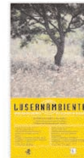
Locandina della mostra "Lusernaambiente", estate 1999

Già negli scorsi anni ha organizzato convegni internazionali, giornate di studio e seminari in ambito storico ma non solo, divenendo gradualmente un'importante istituzione non solo per studiosi e ricercatori che cercano informazioni di carattere specialistico ma anche per tutti coloro che vogliono comprendere ed approfondire le tematiche che di volta in volta diventano oggetto di riflessione.