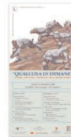
Locandina del convegno "Qualcosa di immenso. Pittura, scrittura e propaganda nella Grande Guerra", settembre 2000

Presso il Centro Documentazione non poteva mancare il Book Shop, l'angolo dedicato all'editoria locale in cui è possibile acquistare pubblicazioni sulla storia di Luserna, sulla Grande Guerra 1914-'18, sulla lingua cimbra o anche semplicemente qualche cartolina.