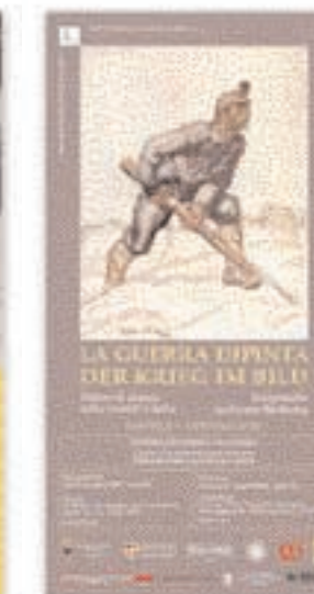
Locandina della mostra "La Guerra dipinta", estate 2000