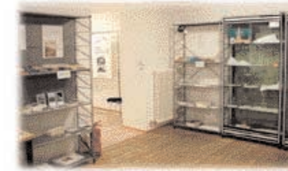
Il Book Shop