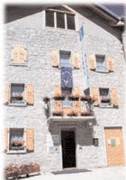
La sede del Centro Documentazione Luserna

Il Centro Documentazione Luserna è una O.N.L.U.S., un'Organizzazione Non Lucrativa di Utilità Sociale.