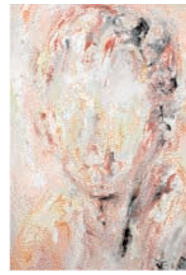
Rheo Martin Pedrazza, olio su tela, 1980

L'arte è una delle massime espressioni dell'animo umano e della cultura di un popolo: a tal fine presso i nostri spazi espositivi è stata realizzata una sala per le opere di artisti locali. Tra le altre, il Centro Documentazione possiede una preziosa collezione di 35 dipinti ad olio e disegni di Rheo Martin Pedrazza.