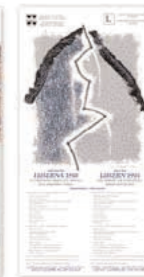
Locandina del convegno "Luserna 1918. La Comunità Cimbra sul crinale della propria storia", novembre 1998