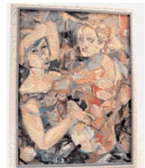
Rheo Martin Pedrazza, olio su masonite, 1959

La prima sezione espositiva del Centro Documentazione è un percorso attraverso la storia di Luserna e dei Cimbri, gli antichi coloni tedeschi di cui la lingua risalente all'XI-XII secolo – la più antica parlata germanica periferica tuttora in uso – e la cultura sono ancora vive testimonianze a Luserna.