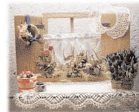
Artigianato di Luserna

Nell'arco degli anni la nostra Fondazione ha ideato ed ospitato moltissime esposizioni temporanee sui temi della storia delle minoranze etniche, su Luserna, sull'arte, sulla Grande Guerra 1914-'18, sulla preistoria e sul territorio alpino. La sezione Esposizioni temporanee può essere, quindi, il pretesto per tornare a visitare il nostro museo anche più volte all'anno, sapendo che ci sarà sempre qualcosa di nuovo ed interessante da vedere.