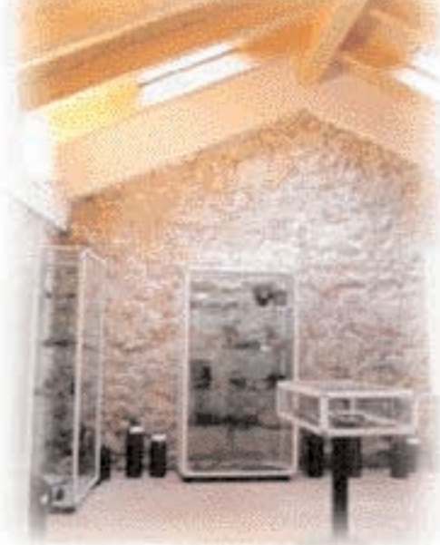
Sala della Grande Guerra