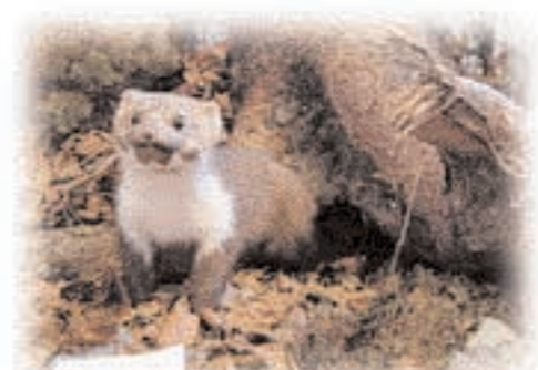
Particolare di una ricostruzione di un ambiente naturale della Sala sulla Natura dell'Altopiano