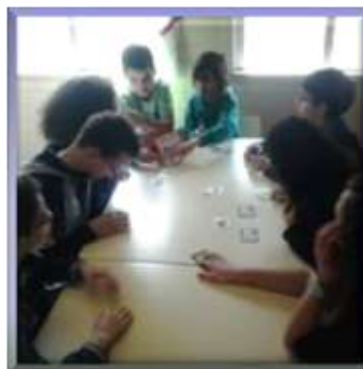
E o jogo vai avançando até se formar a palavra mágica "SuperT"