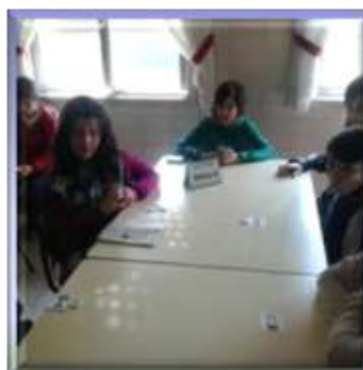
Na primeira ronda, jogaram no nível 2 os jogadores do 5º e 6º anos.