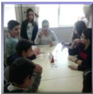
O árbitro, a Lara do 7º7 ano, pelo segundo ano consecutivo, dá início à distribuição das cartas.