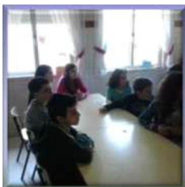
Sentados nos respetivos lugares, estão atentos a todas as instruções dadas por uma das professoras dinamizadoras do campeonato.