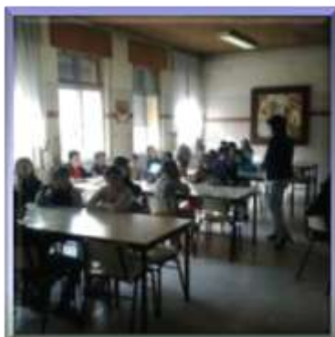
Os jogadores posicionaram-se nas mesas de jogo, após um sorteio.