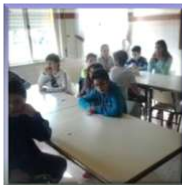
Com muita ansiedade, estão atentos às regras do jogo.