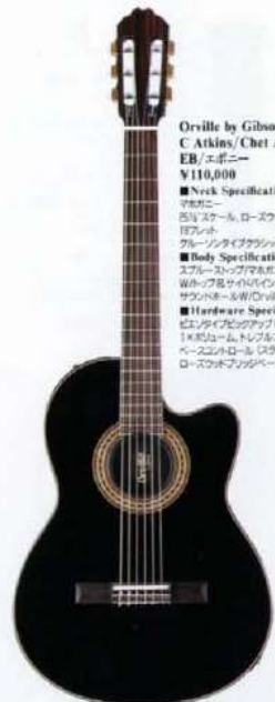
Orville by Gibson C Atkins/Chet Atkins CE EB/エボニー ¥110,000 ■Neck Specifications: マホガニー 5/8"スケール、ローズウッドフィンガーボード 12フレット グレイブレイククラウンモデルマリンヘッド ■Body Specifications: スプレーストリップマホガニーバック ワイルドローズサイトバインディング サウンズホールW/Orville by Gibson デカール ■Hardware Specifications: ビスタクイックアンプ (標準品) 1Xボジウム、トランスコントロール ペースコントロール (ストライトコントロール) ローズウッドブリッジベース、ボディーサイドジョイント