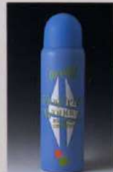
Fingering Wonder New Superb Presto Lemon Spray ¥800

◎オービル by ギブソン製品にベストマッチする メンテナンススプレー「フィンガリングワンダー」 は100%レモンオイルを配合。 極めてスムーズなフィンガリングを可能にするど ともその成分がフレットボードのクリーニング に、ソリ、フレットの磨きに、さらには弦の防錆にも 効果を発揮します。