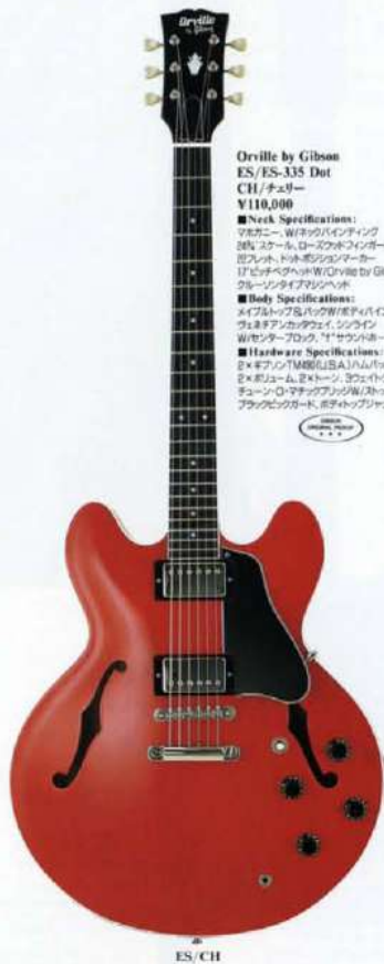
Orville by Gibson ES/ES-335 Dot CH/チェリー ¥110,000

■Neck Specifications: マホニー、Wネックハイディング 89Vスケール、ローズウッドフィンガーボード EPレスト、トントボジションマーカー 17ビッチバケットW/Orville by Gibson & クラウンインレイ クラウンタイアマンヘッド ■Body Specifications: メイプルトップ&バックW/メイハイディング フレットアンカレッジ、シングル W/17サウンズホール ■Hardware Specifications: 2xギブソンTM88LSA11ムバッキングピックアップ 2xギブソンTM20012xトーン、3ウェイヴルスイッチ チューンロ-マチックアジャストW/ストップバーナールピース ブレイクビッドガード、ボチトップリヤック