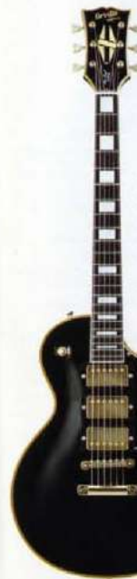
LPC w/3PU EB

■Neck Specifications: マホカニー、Wリブハイブリッド メイプル、ローズウッドフィンガーボード ダブルカットアウェイ、フロアジョイント ITヒートベグヘッドW/Orrville by Gibson S スプリットタイプセントインレイ コロバースタイルフロントプレート ■Body Specifications: マホカニー、Wリブハイブリッド シングルカクタウェイ、カーフトレイブレット ■Hardware Specifications: 1xコイルフレットマシン(TM88)U.S.A.) ハムバッキングピックアップ 1xボトムプレート、2xコイルスリット コイルフレットマシン、2xマキアブリッジ W/ストロークセンサー 3xPLVフレットガード、3xマキアブリッジ