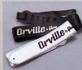
Original Straps Black, White, Brown ¥1,200