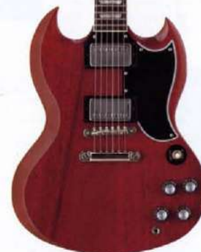
Orville SG-65/SG'62 Re-issue エクストラシン、カスタムコンタクト・ダブルカッタ ウェイボディと、オービルオリジナルハムバッキ ャーの威力で、ライブワークに熱中するエキサイ ト派に贈る、オービル自信のベストコストパフォ ーマーSG-65。

■Neck Specifications: マホガニー、ワイルドフィンディング 24V スタール、ローズウッドフィンガーボード 22フレット、デュラロッドインサレーション 17ピッチペグヘッドW/Orylle by Gibson & クラウンインレイ クルーソングイプアブリゲット ■Body Specifications: マホガニー 3ウェイダブルカッタウェイ ■Hardware Specifications: 2xキープンTMBB(U.S.A.) ハムバッキングピックアップ 2xボリウム、2xトーン、3ウェイ・クルーソングイプ チューン・ロ・マチック・ブレイク・ワ/ストローク コントロール・ピース ブラックピックガード、ブラック・トップ・フィニッシュ