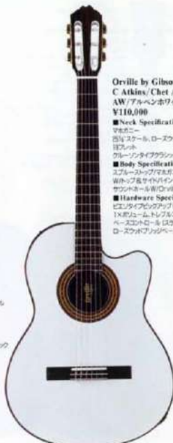
Orville by Gibson C Atkins/Chet Atkins CE AW/アルベンホリゾン ¥110,000 ■Neck Specifications: マホガニー 5/8"スケール、ローズウッドフィンガーボード 12フレット グレイブレイククラウンモデルマリンヘッド ■Body Specifications: スプレーストリップマホガニーバック ワイルドローズサイトバインディング サウンズホールW/Orville by Gibson デカール ■Hardware Specifications: ビスタクイックアンプ (標準品) 1Xボジウム、トランスコントロール ペースコントロール (ストライトコントロール) ローズウッドブリッジベース、ボディーサイドジョイント

誕生以来、たちまちにしてその名を確立したチェット・アトキンスCE =クラシック・エレキリックの名にふさわしく、クラシックギター特有の 人間味ある暖かな音色を、最新のエレキリック技術による驚くほど 広いサステインがサポートしギタリストに新しいサウンド空間 を提供します。