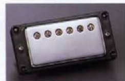
Gibson U.S.A. Pickups

オービルのギブソンギターに搭載されているピックアップはすべて Gibson 特許の Made in U.S.A. LPS、SLS、ES のオリジナルハムバucker は現在希少なためから、ライセンスアウトプット、オーバードライブ増幅用のサウンドはギブソンならではのものです。