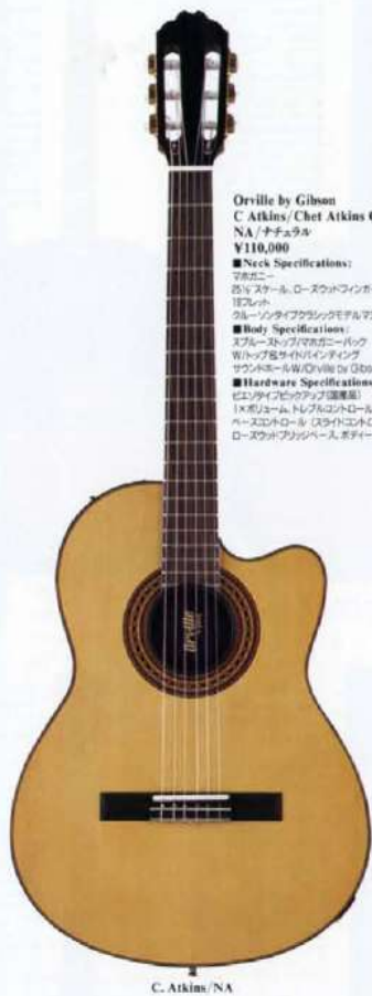
Orville by Gibson C Atkins/Chet Atkins CE NA / ナチュラル ¥110,000 ■Neck Specifications: マホガニー 5/8"スケール、ローズウッドフィンガーボード 12フレット グレイブレイククラウンモデルマリンヘッド ■Body Specifications: スプレーストリップマホガニーバック ワイルドローズサイトバインディング サウンズホールW/Orville by Gibson デカール ■Hardware Specifications: ビスタクイックアンプ (標準品) 1Xボジウム、トランスコントロール ペースコントロール (ストライトコントロール) ローズウッドブリッジベース、ボディーサイドジョイント