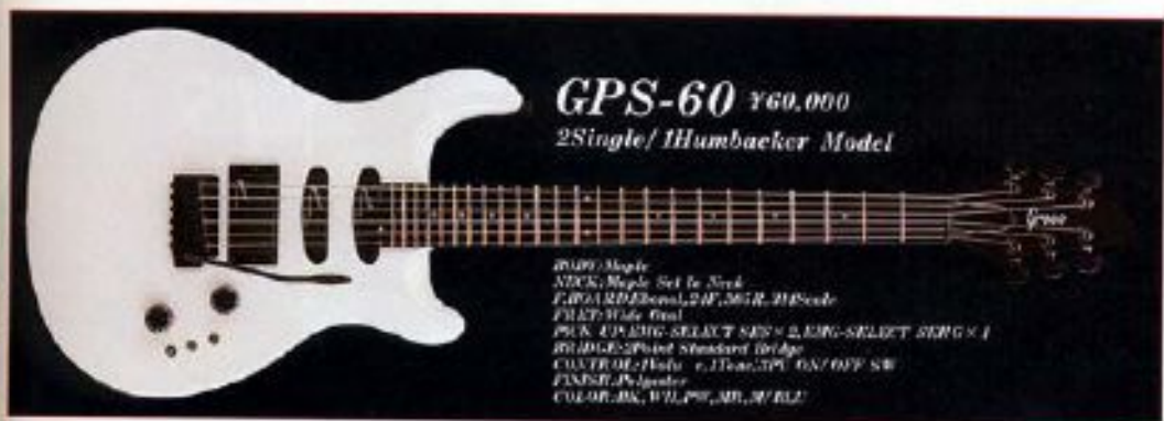
GPS-60 ¥60,000 2Single/1Humbucker Model

EMGが開発した、ハイインピーダンスピックアップ 特性を活かし、ワイヤレス接続やマルチエフェクタ 処理にも対応し、ハイパワーなアンプにも対応した 「EMG-SELECT」は、EMGの「HUMBUCKER」の音質を 再現し、より豊かなサウンドを実現するために開発 された。ハイインピーダンスピックアップ特性を活 かし、ワイヤレス接続やマルチエフェクタ処理に も対応し、ハイパワーなアンプにも対応した。