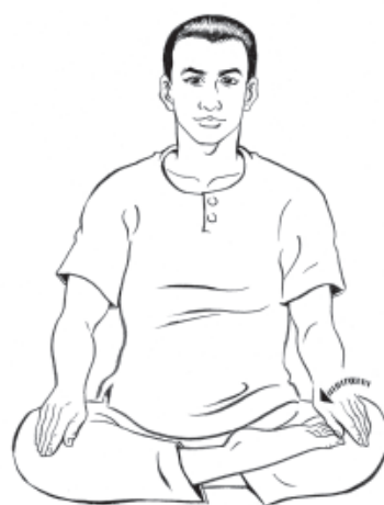
๑๕. คว่ำมือซ้ายลงที่ขาซ้าย...ให้รู้สึก ทำต่อไปเรื่อยๆ...ให้รู้สึก