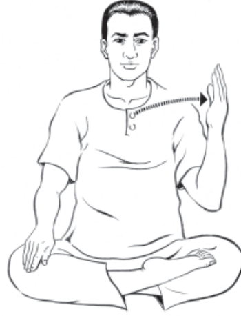
๑๓. เอามือซ้ายออกมาตรงข้าง... ให้มีความรู้สึก