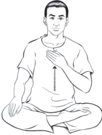
๑๒. เลื่อนมือซ้ายขึ้นที่หน้าอก... ให้มีความรู้สึก