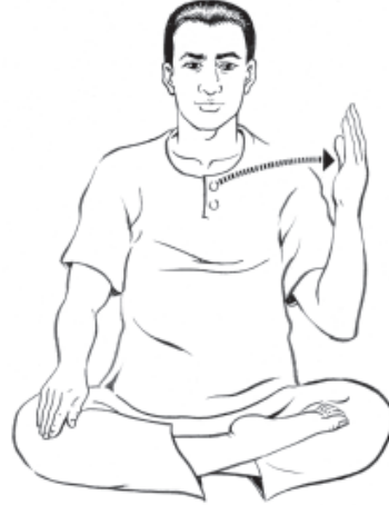
๑๓. เอามือซ้ายออกมาตรงข้าง... ให้มีความรู้สึก