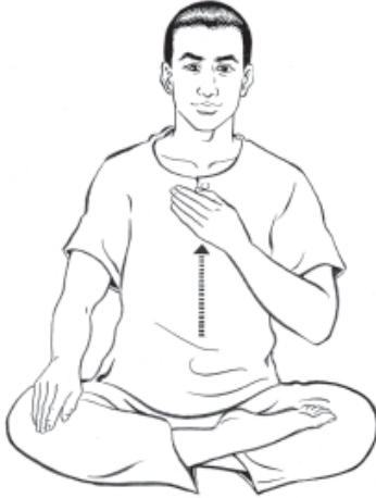
๑๒. เลื่อนมือซ้ายขึ้นที่หน้าอก... ให้มีความรู้สึก