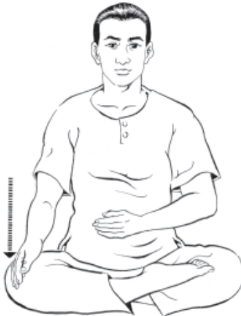
๑๐. ลดมือขวาลงที่ขาขวา ตะแคงไว้...ให้รู้สึก