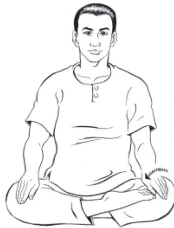
๑๕. คว่ำมือซ้ายลงที่ขาซ้าย...ให้รู้สึก ทำต่อไปเรื่อยๆ...ให้รู้สึก