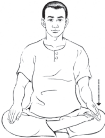
๑๔. ลดมือซ้ายลงที่ขาซ้าย ตะแคงไว้... ให้มีความรู้สึก