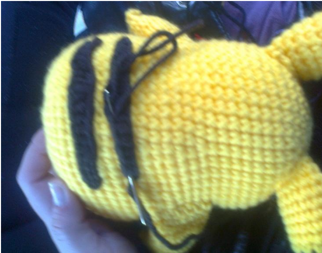
En la parte de atrás, coser las 2 manchas.