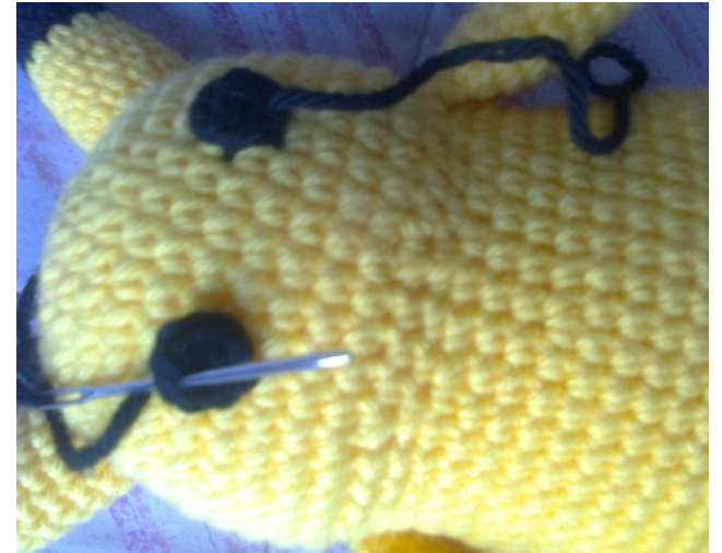
Coser los ojos y los cachetitos a la cara.