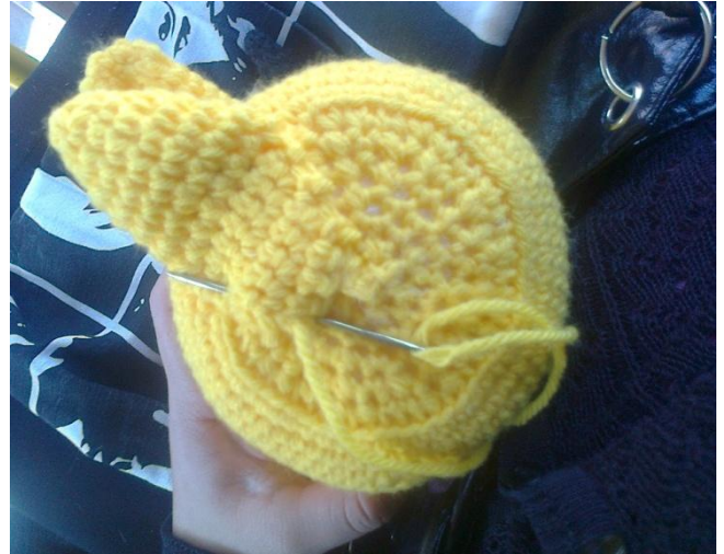
Rellenar apenas las patas. Cerrarlas. Con lana negra, bordarles las divisiones de los dedos. Coserlas al cuerpo.