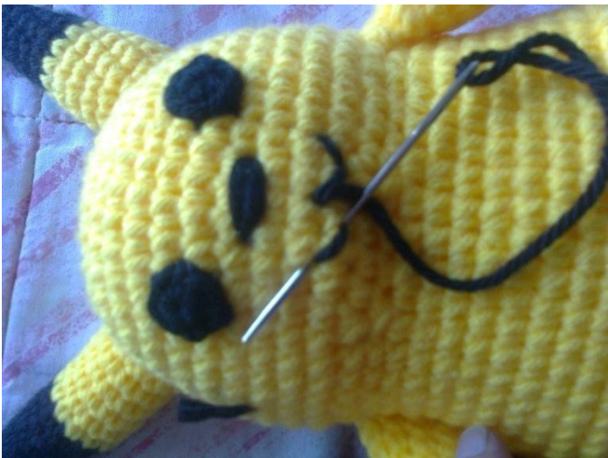
Bordar la naricita y la boquita.