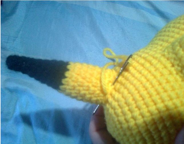
Rellenar apenas las orejas y coserlas a la cabeza.