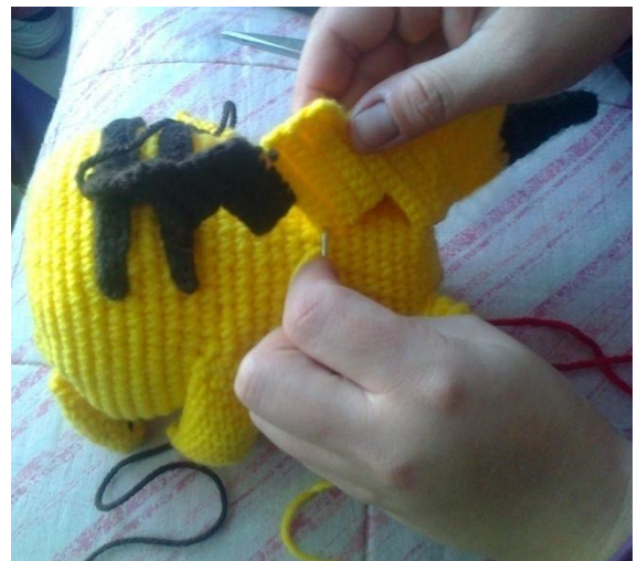
En la espalda, coser la cola haciendo pequeñas puntadas.