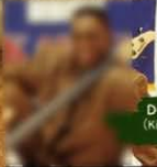
DON PATTERSON (Kirk Whalum Band)