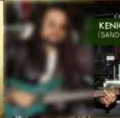
KENICHI INOUE (SANDII+THE SUNSETZ)