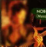
NOBORU KUROSAKI (Masque)