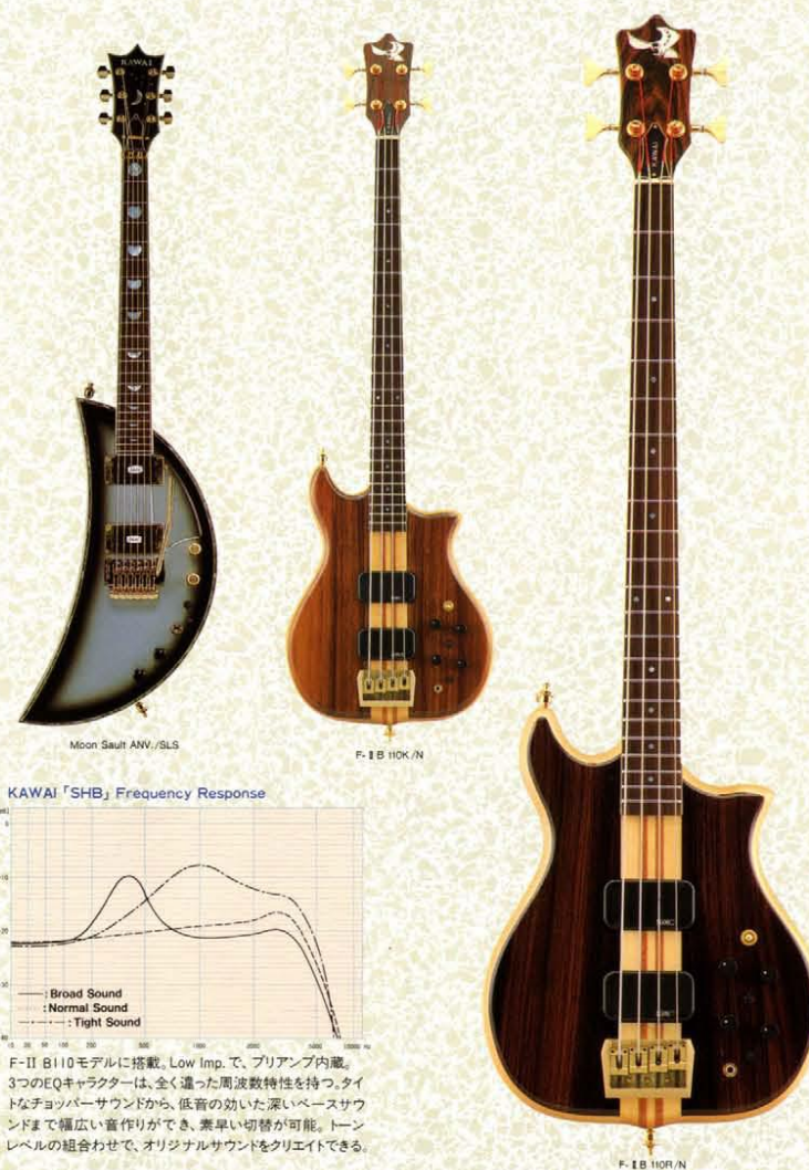
Moon Sault ANV./SLS

ボディ材は、マホガニー単板を使用。マホガニー・セットネックは、幅広い音域特性を十分に引出し、厚みのある音を演出。Schaller「Golden 50VH」のウォームなハムバッキングサウンドを、バランス良(アウトプット)。オリジナル・オールドライブ・サーキットは、質の良い歪みをクリエイトします。人間工学に基づいたボディ形状は、プレイアビリティの高さにも定評があります。