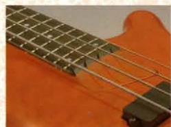
DIS Joint (Deep Inserted Super Joint)

ジョイント精度を飛躍的に向上。弦振動のロスをも最小限にとどめ、深いボディ振動とロングサステインを獲得。ボディ材の特徴を充分に引出し、サウンドのバランスを最高の状態でアウトプットします。