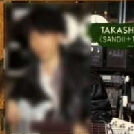
TAKASHI ONZOH (SANDII+THE SUNSETZ)