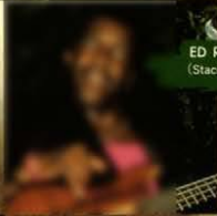
ED REDDICK (Stacey Q Band)