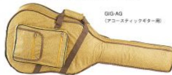
GIG-AG (アコースティックギター用)

外側のポケットを2重にし、弦やケーブル、楽譜なども入れやすくしました。(GIG-AG, EG) 使いやすく丈夫なギグケースです。