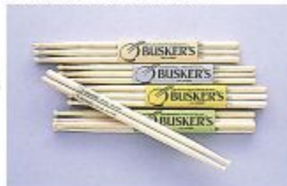
BS-131・BS-141・BS-151・BS-153・BS-161 (USAヒッコリー)

一般的に人気のあるタイプのスティックを3ペア1箱にし、リーズナブルなセットにしました。