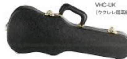
VHC-UK (ウクレレ用高級ハードケース)