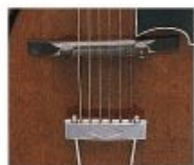
(HBS-C)ブリッジ&テイルピース