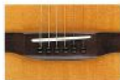
(HMG-SP) 木製ブリッジピン