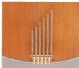
(HJS-II P) テイルピース

Scale: 648mm Bridge: ローズウッド・フィンガーテイルピース Pickup: ミニハムピックアップ x 1 Control: 1Volume・1Tone Color: AN (アンティークナチュラル) *グローバータイプペグ、ゴールドパーツ *フラットワウンド弦使用 *ラッカーフィニッシュ (ヴィンテージスタイル) ハードケース付