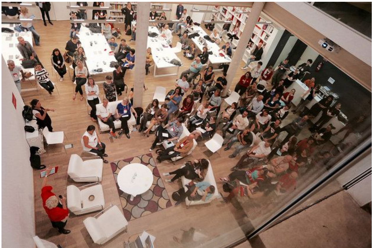
Foto tomada en Las Naves durante la sesión Reporting Narratives de IETM Valencia.