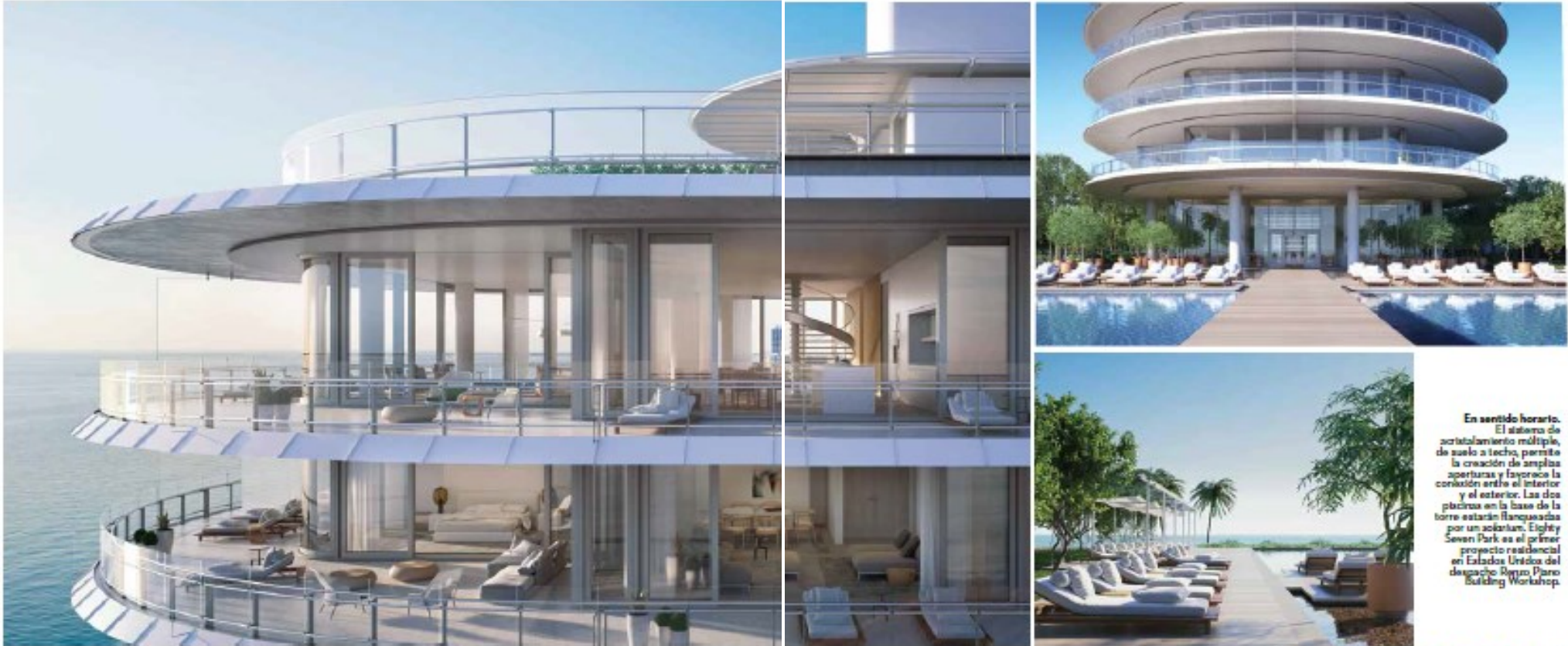
En sentido horario. El sistema de acristalamiento múltiple, de suelo a techo, permite la creación de amplias aperturas y favorece la conexión entre el interior y el exterior. Las dos piscinas en la base de la torre estarán flanqueadas por un solarium. Eighty Seven Park es el primer proyecto residencial en Estados Unidos del despacho Renzo Piano Building Workshop.