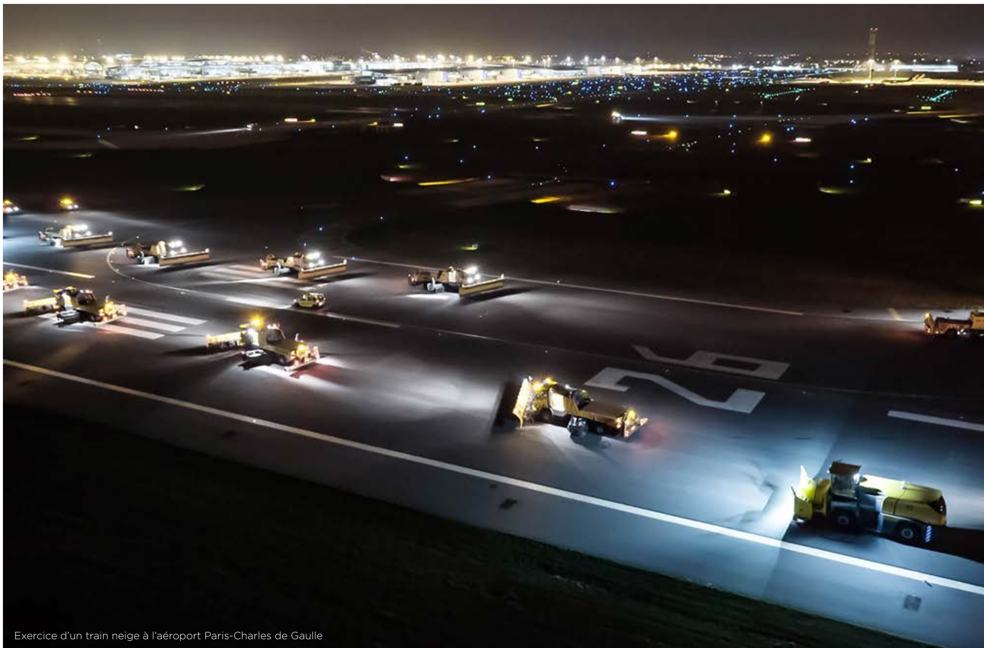
Exercice d'un train neige à l'aéroport Paris-Charles de Gaulle