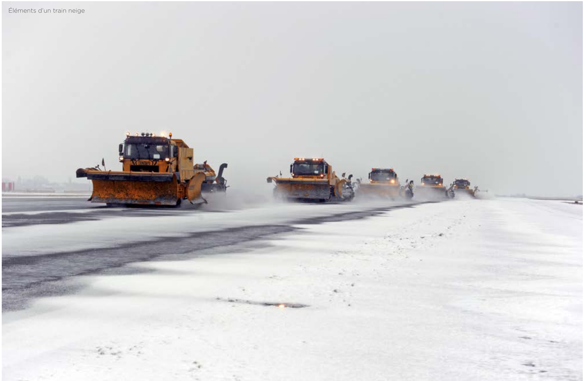
Éléments d'un train neige