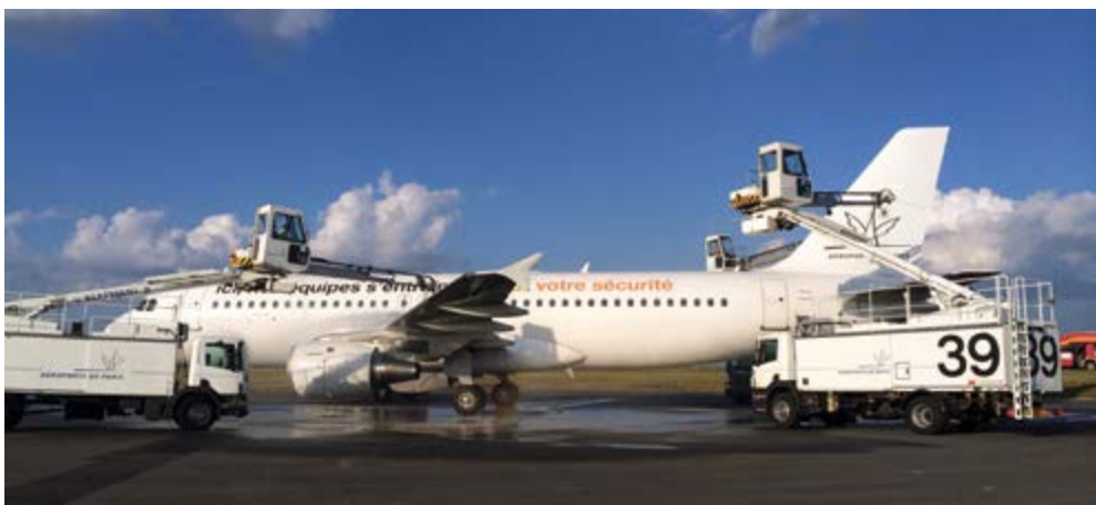
L'A320 du Groupe ADP est stationné tout près de la zone de maintenance Air France et des hangars Fedex. Sur le fuselage on peut lire "Ici, nos équipes s'entraînent pour votre sécurité".

Les équipes de la viabilité hivernale peuvent dégivrer 14 avions simultanément, jusqu'à 50 appareils à l'heure en conditions météorologiques critiques.